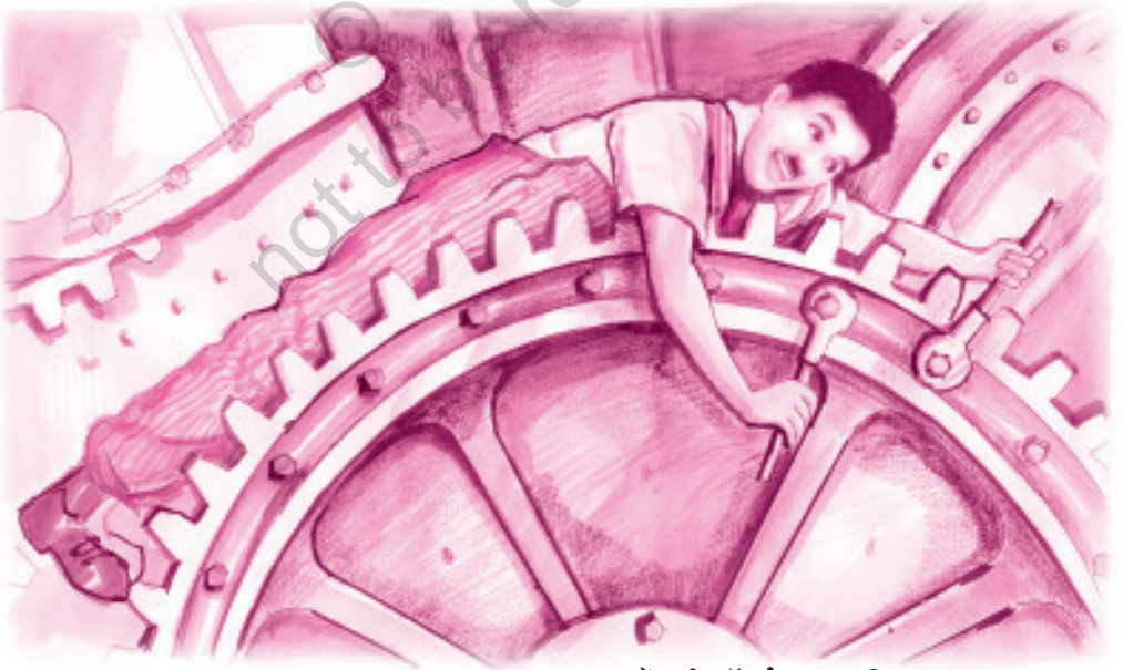
1936 में बनी मॉडर्न टाइम्स फ़िल्म का एक दृश्य

यदि यह वर्ष चैप्लिन की जन्मशती* का न होता तो भी चैप्लिन के जीवन का एक महत्वपूर्ण वर्ष होता क्योंकि आज उनकी पहली फ़िल्म 'मेकिंग ए लिविंग' के 75 वर्ष पूरे होते हैं। पौन शताब्दी से चैप्लिन की कला दुनिया के सामने है और पाँच पीढ़ियों को मुग्ध कर चुकी है। समय, भूगोल और संस्कृतियों की सीमाओं से खिलवाड़ करता हुआ चालीं आज भारत के लाखों बच्चों को हँसा रहा है जो उसे अपने बुढ़ापे तक याद रखेंगे। पश्चिम में तो बार-बार चालीं का पुनर्जीवन होता ही है, विकासशील दुनिया में जैसे-जैसे टेलीविज़न और वीडियो का प्रसार हो रहा है, एक बहुत बड़ा दर्शक वर्ग नए सिरे से चालीं को घड़ी 'सुधारते' या जूते 'खाने' की कोशिश करते हुए देख रहा है। चैप्लिन की ऐसी कुछ फ़िल्में या इस्तेमाल न की गई रीलें भी मिली हैं जिनके बारे में कोई जानता न था। अभी चैप्लिन पर करीब 50 वर्षों तक काफ़ी कुछ कहा जाएगा।