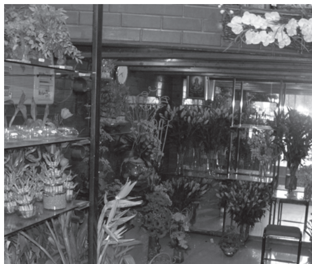
फूलों की खेती

बीजों तथा कृषि कार्य हेतु जानकारी का एकमात्र स्रोत होते हैं, और निःसंदेह वे अपने उत्पाद बेचने के इच्छुक होते हैं। इससे किसानों की महँगी खाद और कीटनाशकों पर निर्भरता बढ़ी है, जिससे उनका लाभ कम हुआ है, बहुत से किसान ऋणी हो गए हैं, तथा ग्रामीण क्षेत्रों में पर्यावरण संकट भी पैदा हुआ है।