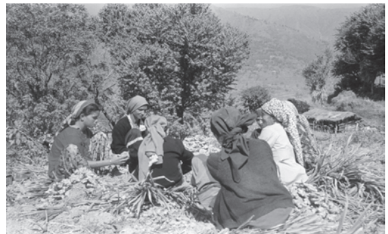
देश के विभिन्न भागों में कृषि कार्य

1960 व 1970 के दशक में कृषि विकास द्वारा ग्रामीण सामाजिक संरचना को बदलने वाला एक तरीका नयी तकनीक अपनाने वाले मध्यम तथा बड़े किसानों की समृद्धि थी, जिसकी चर्चा पूर्व भाग में की गई है। अनेक कृषि संपन्न क्षेत्रों जैसे तटीय आंध्रप्रदेश, पश्चिमी उत्तर प्रदेश तथा मध्य गुजरात में प्रबल जातियों के संपन्न किसानों ने कृषि से होने वाले लाभ को अन्य प्रकार के व्यापारों में निवेश करना प्रारंभ कर दिया। विविधता की इस प्रक्रिया से नए उद्यमी समूहों का उदय हुआ जिन्होंने ग्रामीण क्षेत्रों से इन विकासशील क्षेत्रों के बढ़ते कस्बों की ओर पलायन किया, जिससे नए क्षेत्रीय अभिजात वर्गों का उदय हुआ जो आर्थिक