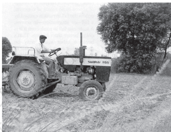
कृषि व्यवस्था में बदलती हुई तकनीकें

इस प्रकार त्वरित कृषि विकास वाले क्षेत्रों में पुराने भूमि अथवा कृषि समूह का समेकन हुआ, जिन्होंने स्वयं को एक गतिमान उद्यमी, ग्रामीण नगरीय प्रबल वर्ग के रूप में परिवर्तित कर लिया। लेकिन अन्य क्षेत्रों जैसे पूर्वी उत्तर प्रदेश तथा बिहार में प्रभावशाली भू-सुधारों का अभाव, राजनीतिक गतिशीलता तथा पुनर्वितरण के साधनों के कारण वहाँ तुलनात्मक रूप से कृषिक संरचना तथा अधिकांश लोगों की जीवन दशाओं में थोड़े बदलाव हुए। इसके विपरीत केरल जैसे राज्य विकास की एक भिन्न प्रक्रिया से गुजरे जिसमें राजनीतिक गतिशीलता, पुनर्वितरण के साधन तथा बाह्य अर्थव्यवस्था (मूल रूप से खाड़ी के देश) से जुड़ाव ने ग्रामीण परिवेश में भरपूर बदलाव किया। केरल में ग्रामीण क्षेत्र मूल रूप से कृषि प्रधान होने के बजाए मिश्रित अर्थव्यवस्था वाला है जिनमें कुछ कृषि कार्य खुदरा विक्रय तथा सेवाओं के एक विस्तृत संजाल के साथ जुड़ा हुआ है, और जहाँ एक बड़ी संख्या में परिवार विदेश से भेजे जाने वाले धन पर निर्भर हैं।